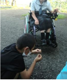
※写真撮影のために、 マスクを外しています。