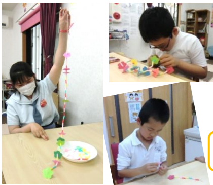
母の日の プレゼント作り♡

梅雨時期から夏に移り変わるこの季節、だるさや体調不良を感じることも多くあるかもしれません。栄養と休息を十分にとって健康管理に留意しましょう。また、引き続き新型コロナウイルスの予防対策を十分に行い、子どもも大人も元気に夏を迎えられるようにしましょうね。