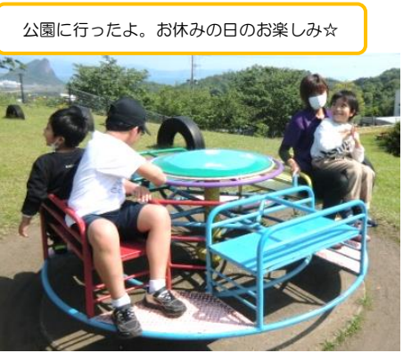
公園に行ったよ。お休みの日のお楽しみ☆