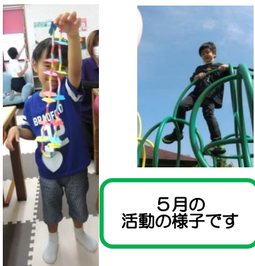
5月の 活動の様子です