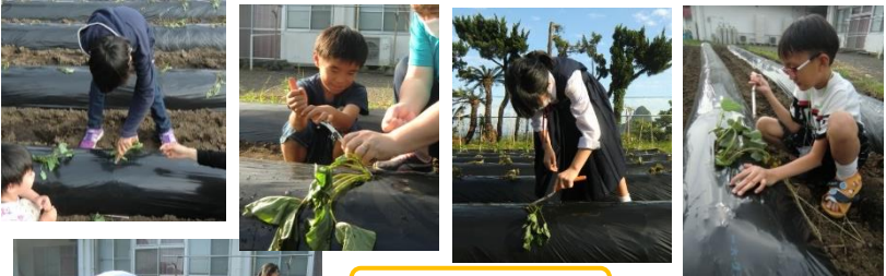
芋の苗を植えました！